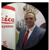
Ángel Herranz LEICA GEOSYSTEMS